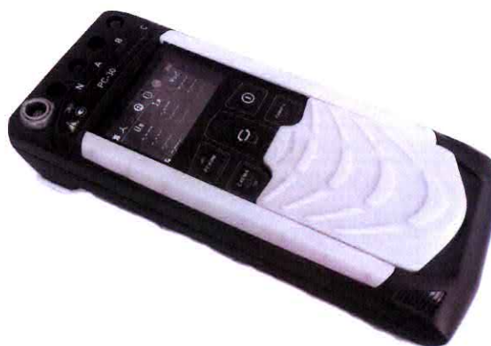
Рисунок 1 – Общий вид вольтамперфазометров РС-30

Несанкционированный доступ внутрь приборов предотвращается пломбированием винта крепления под крышкой аккумуляторного отсека. Схема пломбирования приведена на рисунке 2.