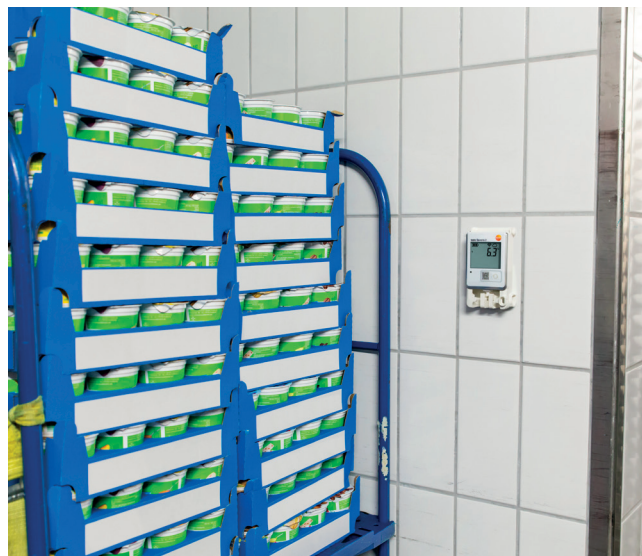
Система testo Saveris 2 позволяет легко и быстро осуществлять мониторинг всех холодильных помещений.

Поскольку в супермаркетах несколько охлаждаемых зон, их мониторинг и документирование требует немалых усилий. Кроме того, некоторые сотрудники могут быть не в курсе новейших требований HACCP или не иметь навыков работы с измерительными приборами.