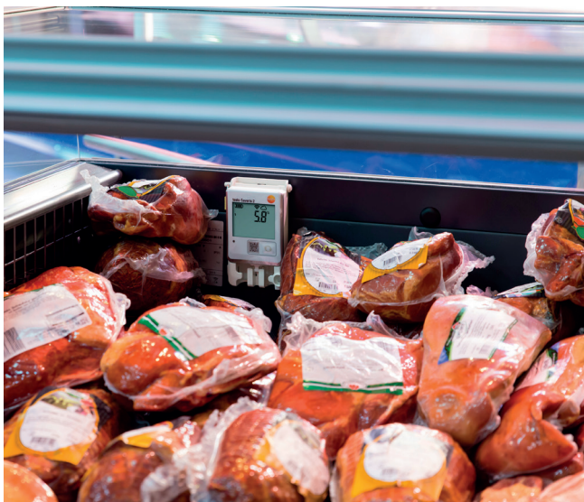
С WiFi-логгерами данных Вам больше не придется тратить время на считывание показаний с каждой точки измерения вручную.