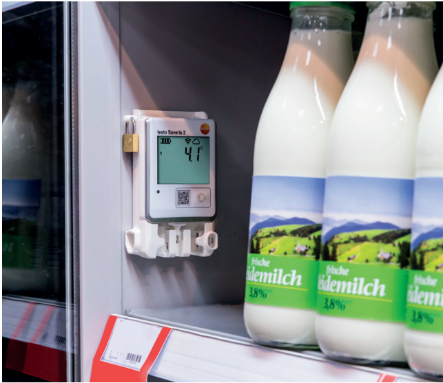
WiFi-логгеры данных передают измеренные значения из охлаждаемой зоны напрямую в Облако Testo Cloud, где они хранятся.